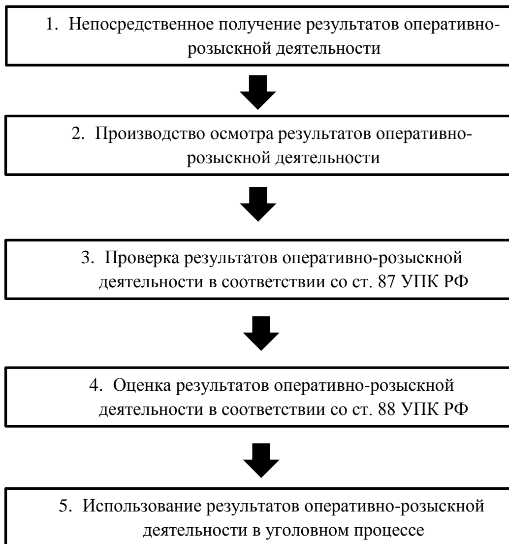
Рисунок 2.1. Следственный этап расследования при получении результатов ОРД

Считаем целесообразным раскрыть более подробно сущность каждого этапа. Для примера возьмем деятельность следователя.